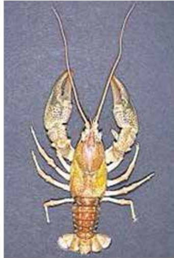
Steinkrebs Austropotamobius torrentium