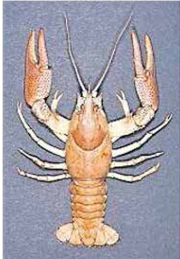
Edelkrebs Astacus astacus